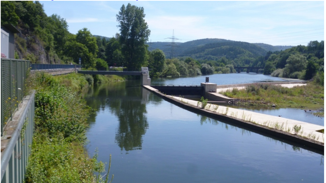
Stauanlage Unkelmühle mit Blick von der Pilotanlage flussaufwärts auf den Rückstau Smoltabwanderung an der Sieg